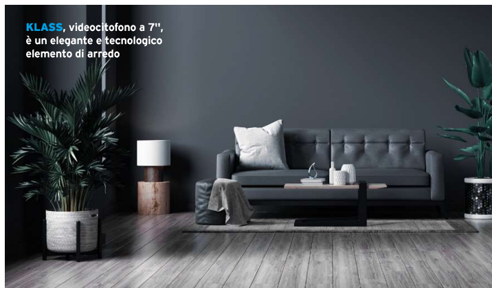
KLASS , videocitofono a 7", è un elegante e tecnologico elemento di arredo